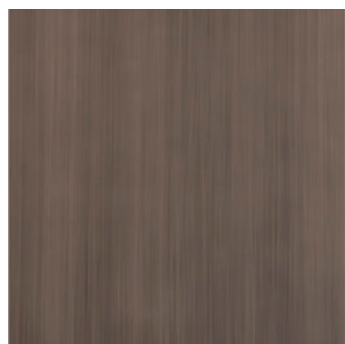
Oro Spazzolato F75