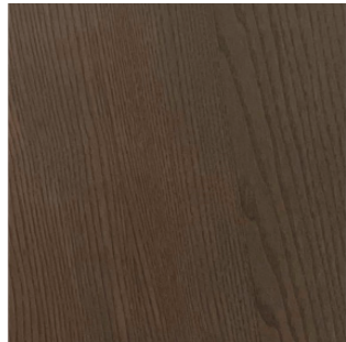
Frassino grigio chiaro F50