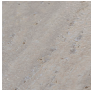
Ceramica Travertino CE10