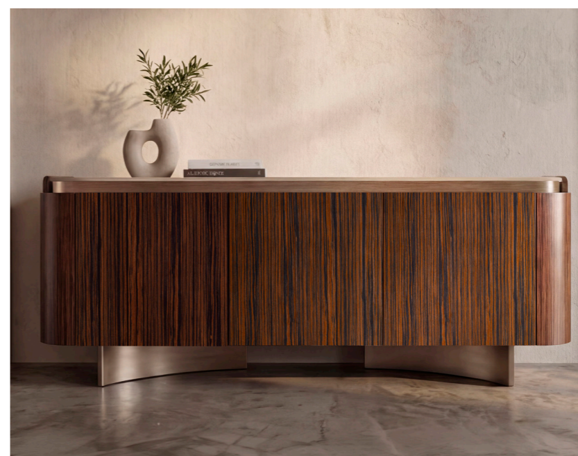
Arcadia Madia tre ante

Art. AT216 L.188 P.46 H.76 CM finitura: top CE10, scocca ed ante F80, inserto frontale e gambe F75