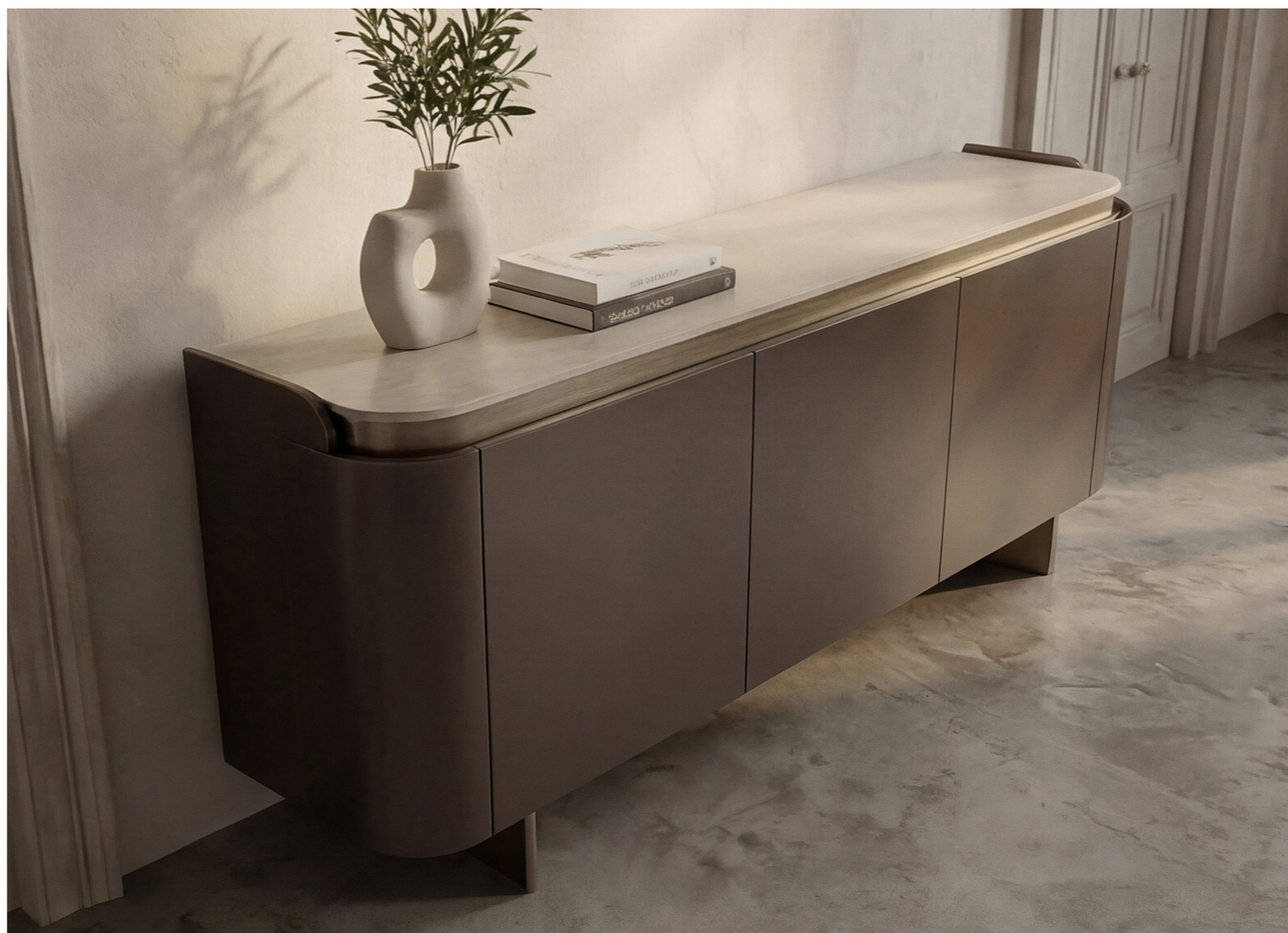
Arcadia Madia tre ante

Art. AT216 L.188 P.46 H.76 CM finitura: top CE10, scocca e ante F70, inserto frontale e gambe F75